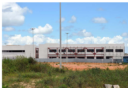
Departamental Campus de Lagarto