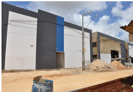
Galpão de Topografia e Eng. Pesca