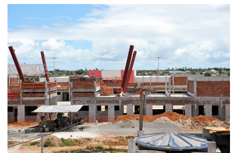
Vivência Campus de Lagarto