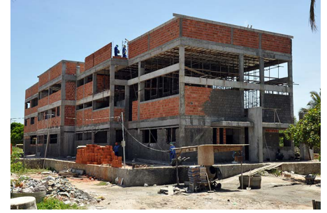
Depart. Engenharia Florestal