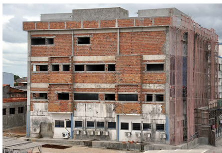
Ampliação anexo hospitalar HU