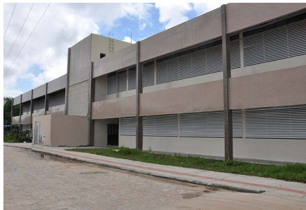
Reforma e adequação Didática