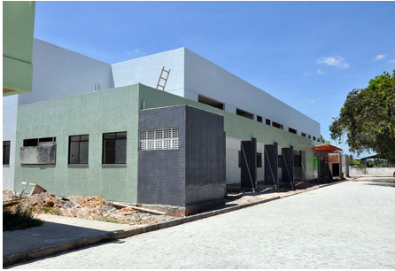
Hospital de Medicina Veterinária