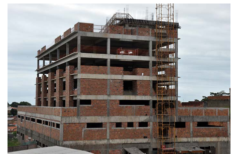
Prédio Materno-infantil - HU