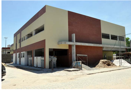
Depart. de Zootecnia