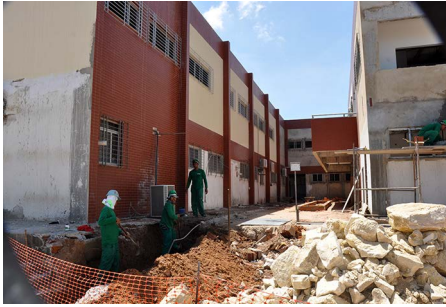
Depart. Engenharia de Alimentos