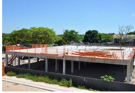
Depart. Engenharia da Computação