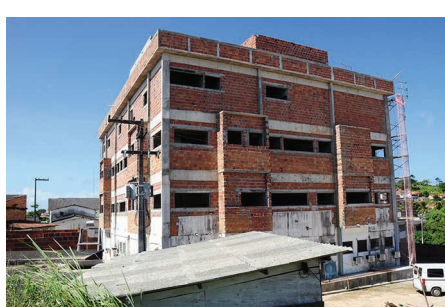
Ampliação anexo hospitalar HU