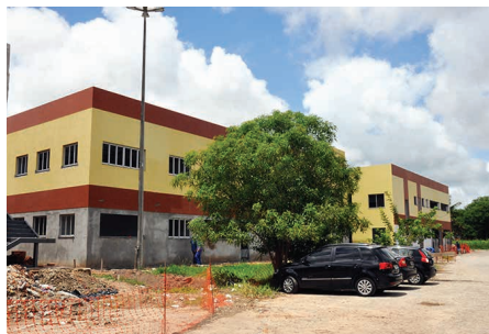
Depart. de Zootecnia