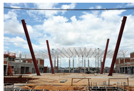
Vivência Campus de Lagarto