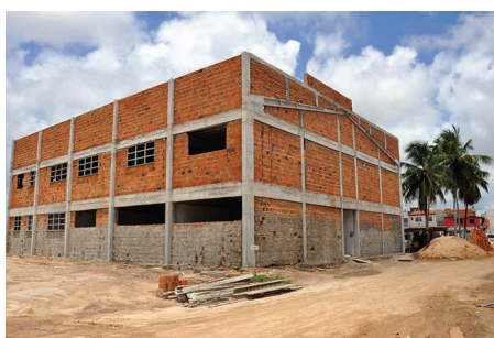
Galpão de Biologia e Eng. Florestal