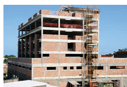
Prédio Materno-infantil - HU