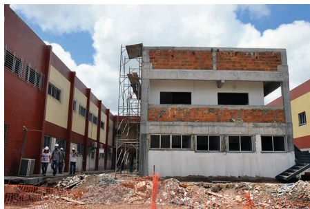
Depart. Engenharia de Alimentos