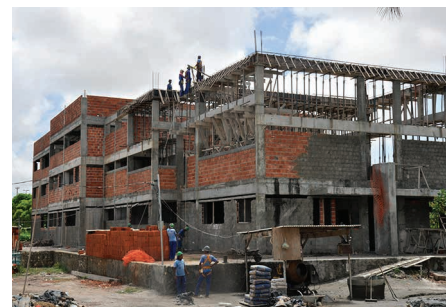
Depart. Engenharia Florestal