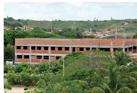
Depart. Engenharia Florestal