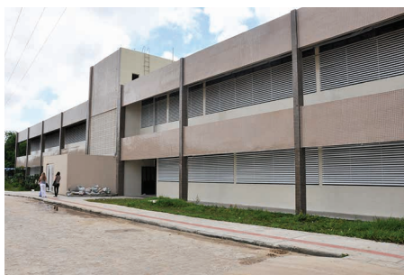
Reforma e adequação Didática