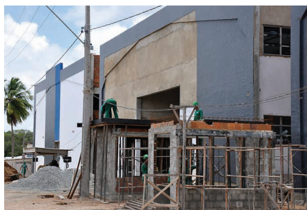
Galpão de Topografia e Eng. Pesca