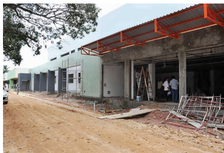
Hospital de Medicina Veterinária