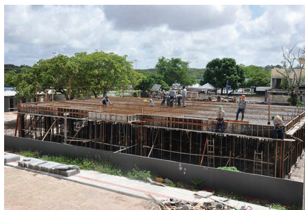
Depart. Engenharia da Computação